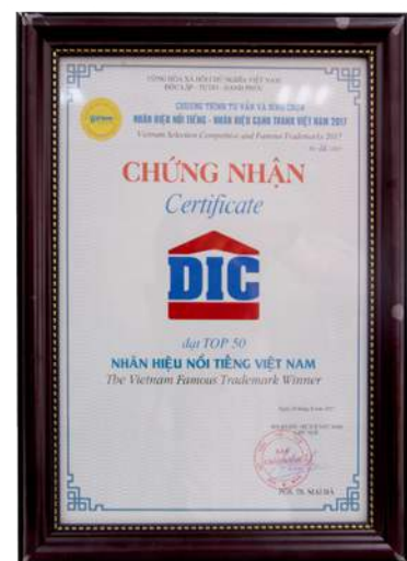
Chứng nhận Top 50 “Nhân hiệu nổi tiếng Việt Nam”.

“Nhân hiệu nổi tiếng – Nhân hiệu cạnh tranh” là chương trình bình chọn quy mô toàn quốc nhằm tôn vinh doanh nghiệp hoạt động chất lượng, hiệu quả và thương hiệu uy tín trong thời kỳ hội nhập, cạnh tranh quốc tế.