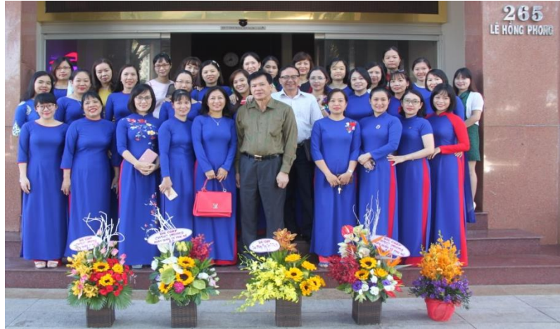
Ảnh: Tập thể CBCNV nữ DIC Corp chụp hình lưu niệm cùng lãnh đạo